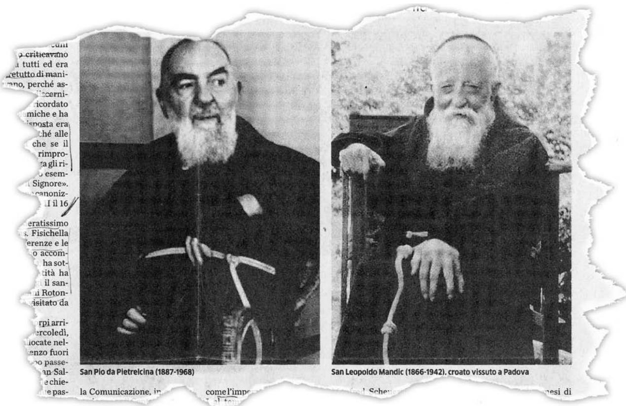
San Pio da Pietrelcina (1887-1968)