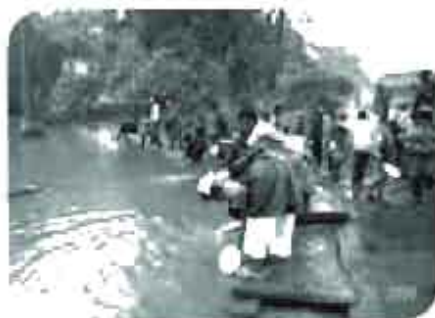
Dopo colazione: ciascuno lava il piatto. Dove?