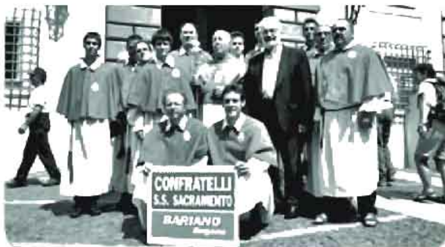
I confratelli a Castel Gandolfo dopo l'Angelus del Papa.