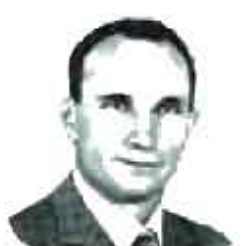
Pagani Alessandro 27° anniversario