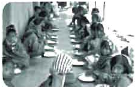
Colazione dei bimbi: piatto unico. Riso.