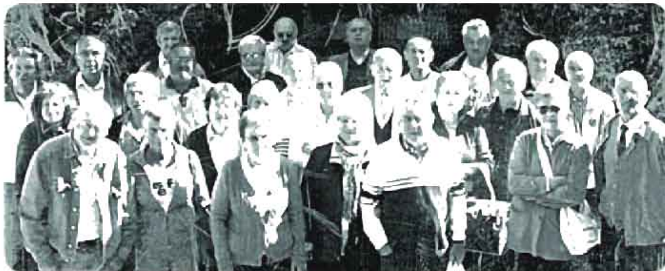
Il 9 settembre il gruppo anziani di Bariano si è recato in gita socio-culturale all'abbazia di Piona, Monastero benedettino sulla collina di Olgiasca, quasi al cominciare del Lago di Como.