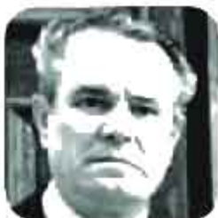
Bassi Santo 15° anniversario