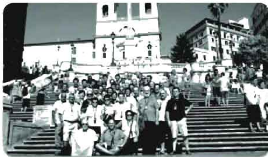
Il gruppo in piazza di Spagna.