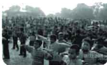
Sono le 7. Pronti per la scuola!