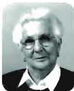
Milani Domenica 1° anniversario