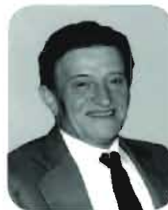
Dedotti Avellino anni 77