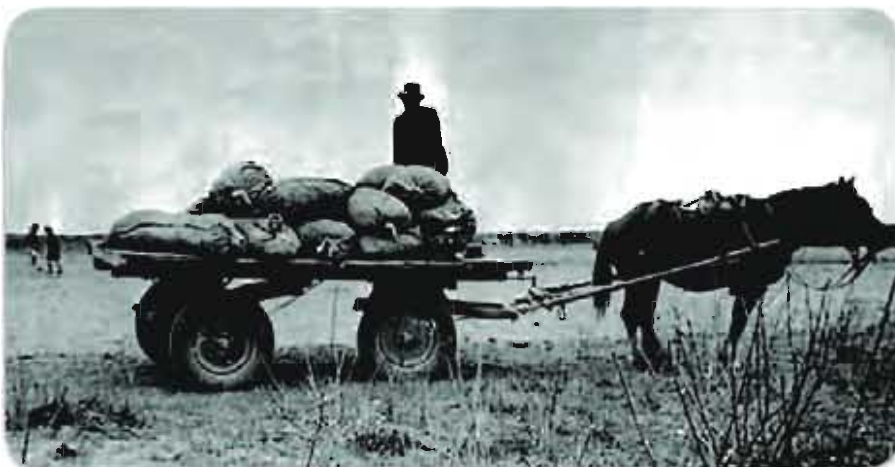
Questa riproduzione è in omaggio a don Luigi Paganessi, che volle le sue opere a favore della gente dei campi.

Figura imponente e maestosa ma insieme paterna e buona, Paganessi è un simbolo per Bariano; Basta pronunciare il suo nome per rievocare tutto un periodo storico, avvenimenti sociopolitici precisi, leggendarie avventure vissute all'insegna dell'amore per una comunità povera e bisognosa di tutto o per vedere scorrere come in un film le iniziative poliedriche da lui promosse negli anni a cavallo della prima grande guerra, negli anni difficili del fascismo e della grande crisi mondiale. Di don Paganessi si potrebbe dire: "una ne pen-