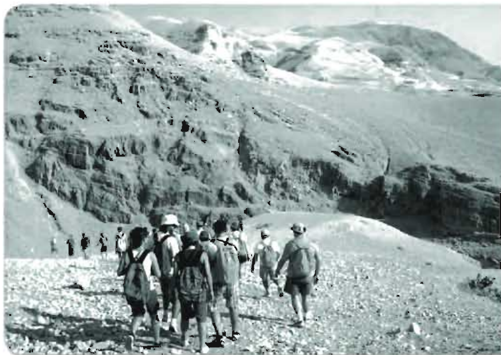
Israele: Il deserto delle tentazioni.